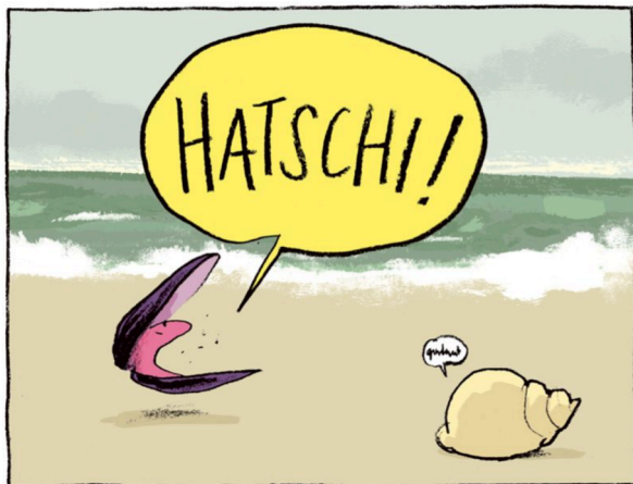
Was liegt am Strand, redet undeutlich und ist erkältet?

Auf der CD „Was liegt am Strand und redet undeutlich? & Was sitzt im Wald und winkt?“ tummeln