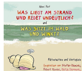
Cover zu „Was liegt am Strand und redet undeutlich?“

Ja, was liegt nur am Strand und redet undeutlich? Man findet da so einiges, Muscheln, Steine, angeschwemmte Hölzer... aber hätten Sie bei der obigen Frage an „Nuscheln“ gedacht? Und was ist bunt und rennt über den Tisch? Na? Ein „Fluchtsalat“ natürlich! Kinder lieben Rätselwitze und humorvolle Wortspiele, bei denen man seinen Verstand einsetzen und am Ende trotzdem über die Antwort lachen muss. Und selbst wenn man auf der Suche nach der Antwort nicht auf die richtige Lösung kommt, so ist man in jedem Fall sehr kreativ.