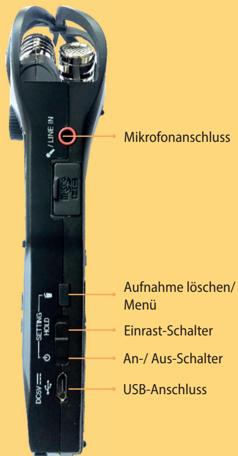
Rechte Seite des Geräts