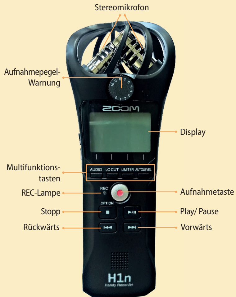
Vorderseite des Geräts